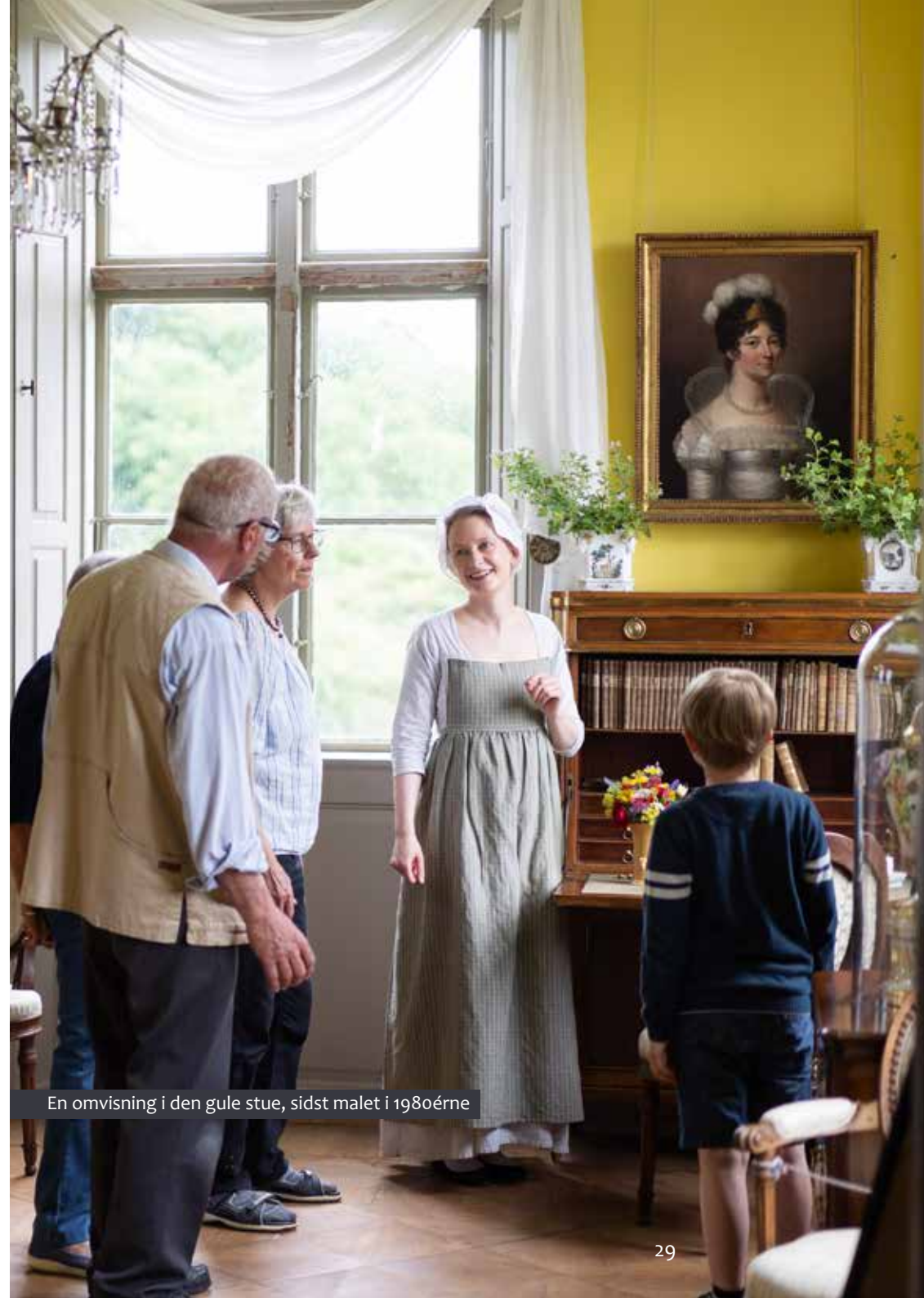
En omvisning i den gule stue, sidst malet i 1980'erne

I sommeren 2021 opstod i den ånd en ny fortælling i udstillingen. I Museum