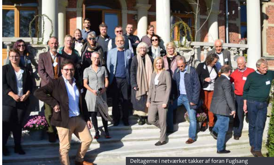
Deltagerne i netværket takker af foran Fuglsang

Undervejs i projektet blev det mere og mere tydeligt, hvor stor betydning den historiske udvikling siden Anden Verdenskrig har haft for herregårdene. En vigtig erfaring, vi har gjort os, er, at i netværkets vestlige lande, Danmark og Sverige, er herregårdenes forhold i dag anderledes, end de var for 100 år siden. Alle privilegier er forsvundet. Mange herregårde arbejder for at udvide deres indtjening fra andet end landbrug. Det indbefatter, at herregårdene åbner sig mod offentligheden med hoteldrift, spisesteder, rundvisninger eller lignende. Hovedsageligt er herregårdene stadigvæk store, familiedrevne landbrug,