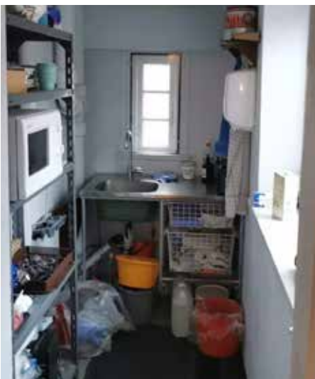
Foto af det nedslidte køkken