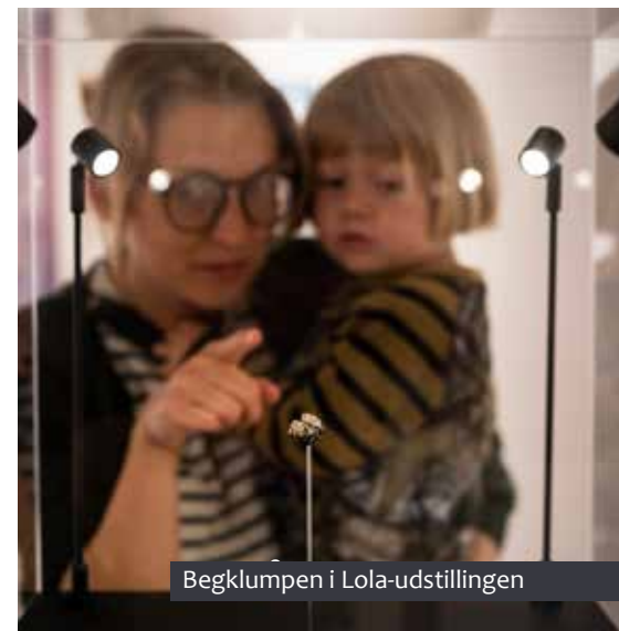
Begklumpen i Lola-udstillingerne

BESUCHEN SIE UNS UND NUTZEN SIE UNSERE ANGEBOTE, DENN WIR MÖCHTEN GERNE IHR MUSEUM SEIN!