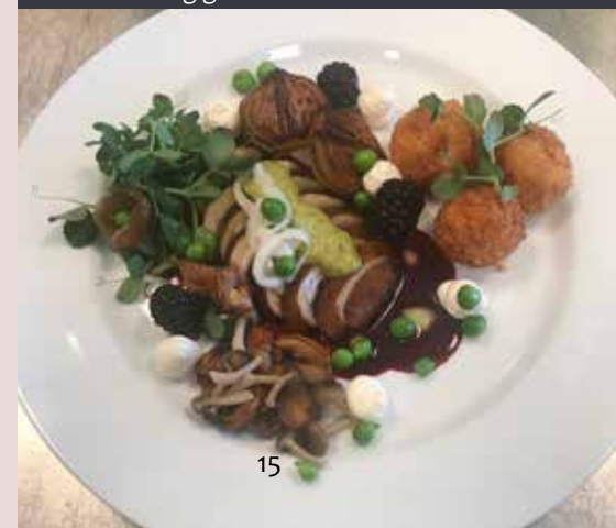
Madkultur og gode råvarer

Kokkeelevernes undervisningsforløb handlede om 'dansk/fransk gastronomisk udvikling' og blev gennemført i samarbejde med faglærer Jesper Kaad. Forløbet bestod af oplæg om dansk-franske gastronomiske traditioner, lokal råvarehistorie og terroir-effekt. Eleverne fik stillet opgaven at udvikle en helt ny ret, en 'nationalret fra Lolland-Falster', inspireret af lokal geografi, begivenheder eller lokale personligheder, ligesom man kender det fra fransk gastronomi.