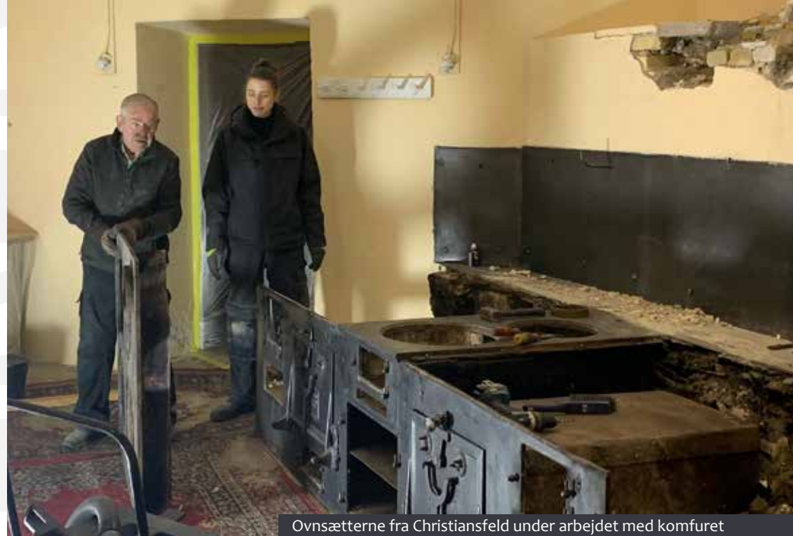
Ovnsætterne fra Christiansfeld under arbejdet med komfuret

Restaureringen af køkkenet handlede nemlig ikke kun om bygningsvedligehold. Den transformerede kælder til en aktiv del af museet.