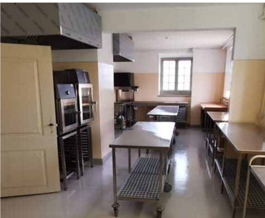
Det færdige undervisningskøkken på Reventlow-Museet Pederstrup

gerne føre et stort vandør ned under det kommende stengulv, fordi røret dels skæmmede rummets æstetiske udtryk, dels ikke hørte til i den oprindelige kælder. Men da bygningen er fredet, kan man ikke bare grave sådan et rør ned i jordgulvet. Derfor blev den lille 20-25 centimeter dybe og spade-brede nedgravning gennemført af en af museets middelalderarkæologer med Slots- og Kulturstyrelsens godkendelse.