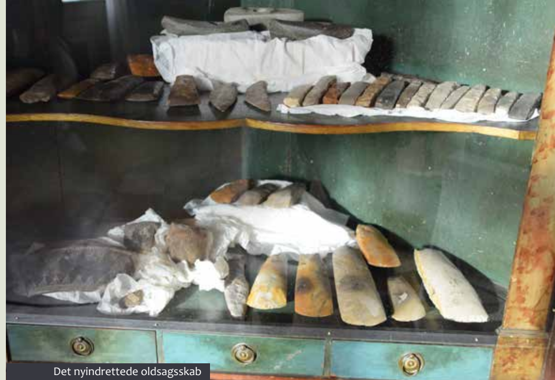
Det nyindrettede oldsagsskab

I de kommende år fortsætter vi med aktivt at arbejde med denne tilgang. Planen, som den er udstykket i den nye helhedsplan betyder, at også overetagen i huset, i løbet af det næste årti, skal