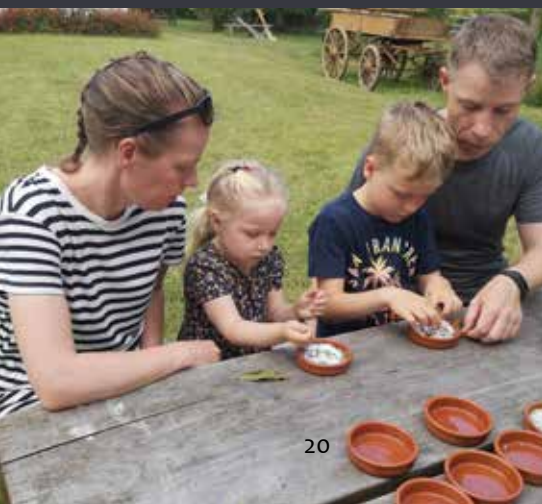
Kryddersalt-workshoppen i De Gamle Huse

Kommentarer som nedenstående, både varmere og giver indsigt i gæsternes tanker efter et arrangement: ”Vi kommer gerne og meget på museer i ind- og udland. Men efter besøget i dag har jeg fået øjnene op for, hvad