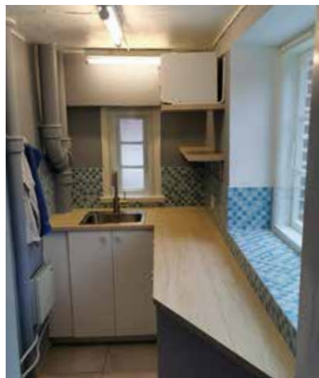
Det nye køkken i Færgestræde