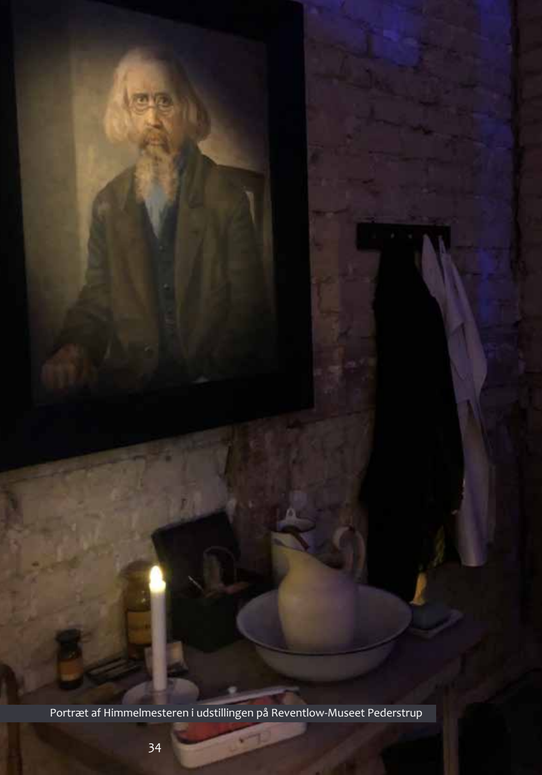
Portræt af Himmelmesteren i udstillingen på Reventlow-Museet Pederstrup