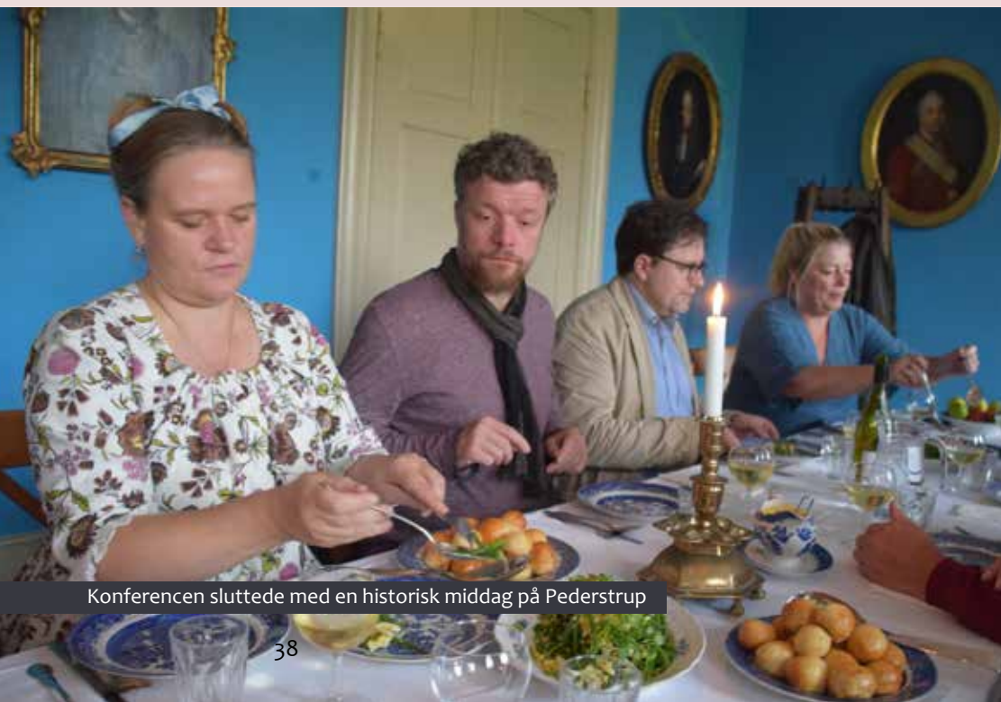
Konferencen sluttede med en historisk middag på Pederstrup

nemlig hovedbygningen på Fuglsang, samlede projektdeltagerne op på den vidn, som arbejdet i netværket havde genereret. Efter halvandet års pandemi var det tilmed en stor glæde at være værter for det første fysiske møde, siden pandemien startede. På den sidste konferencedag var deltagerne på tur rundt i herregårdslandskabet på Lolland og Falster. De besøgte både parken på Christianssæde og det næsten færdigrestaurerede Dronning Sofies Hus på Halsted Kloster. Dagen endte med en middag i den store sal på Pederstrup med retter som på C.D.F. Reventlows tid. Det var i sandhed en værdig afslutning på et spændende og givtigt internationalt samarbejde.