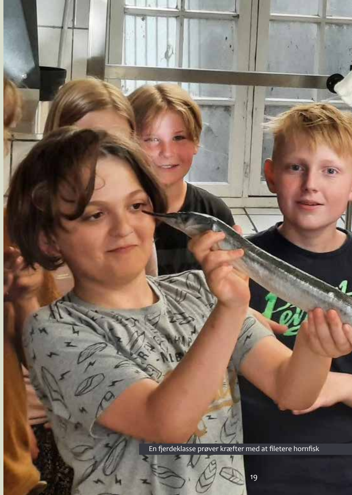
En fjerdeklasse prøver kræfter med at filetere hornfisk

Anderledes frit var det, da vi inviterede familier til kryddersalt-workshops i forbindelse med de øvrige Sommersjov-aktiviteter i De Gamle Huse – Maribos frilandsmuseum hen over sommeren. Det var en festlig work-