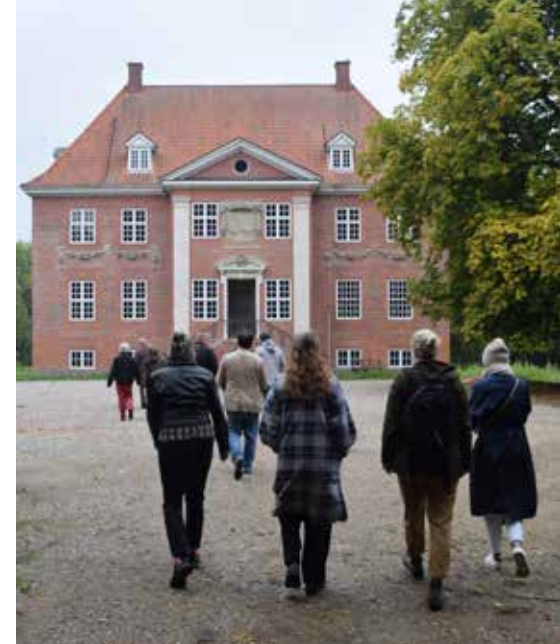
Ture til forskellige herregårde på Lolland

Mange herregårde arbejder for at udvide deres indtjening fra andet end landbrug. Det indbefatter, at herregårdene åbner sig mod offentligheden med hoteldrift, spisesteder, eller rundvisninger.