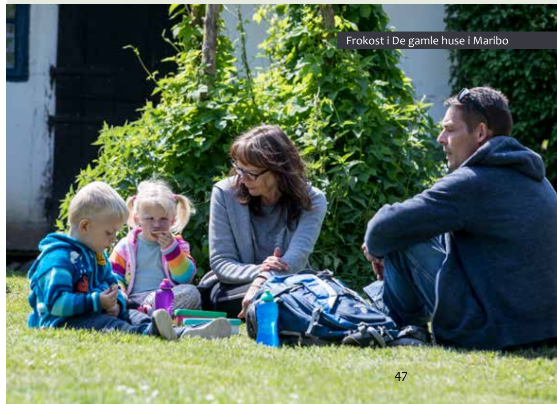
Frokost i De gamle huse i Maribo

Museum Lolland-Falster klarer sig rigtig godt på flere områder i Den nationale brugerundersøgelse. Vi ligger over landsgennemsnittet på stort set alle spørgsmålene i brugerundersøgelsen.