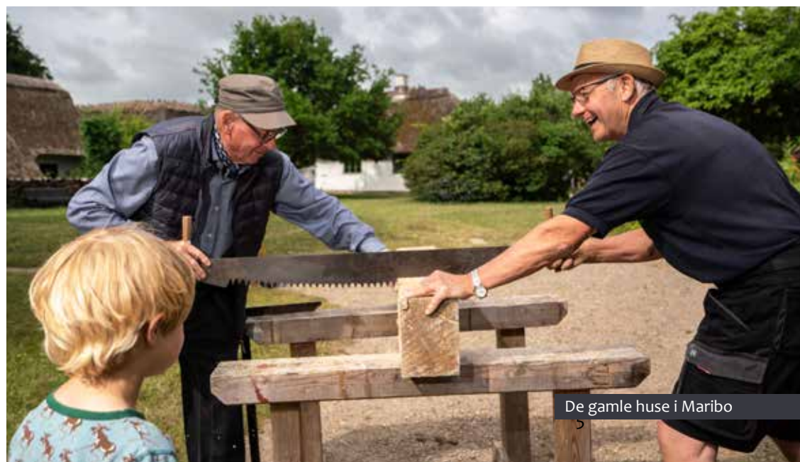
De gamle huse i Maribo

BRUG OS, FOR VI VIL GERNE VÆRE DIT MUSEUM!