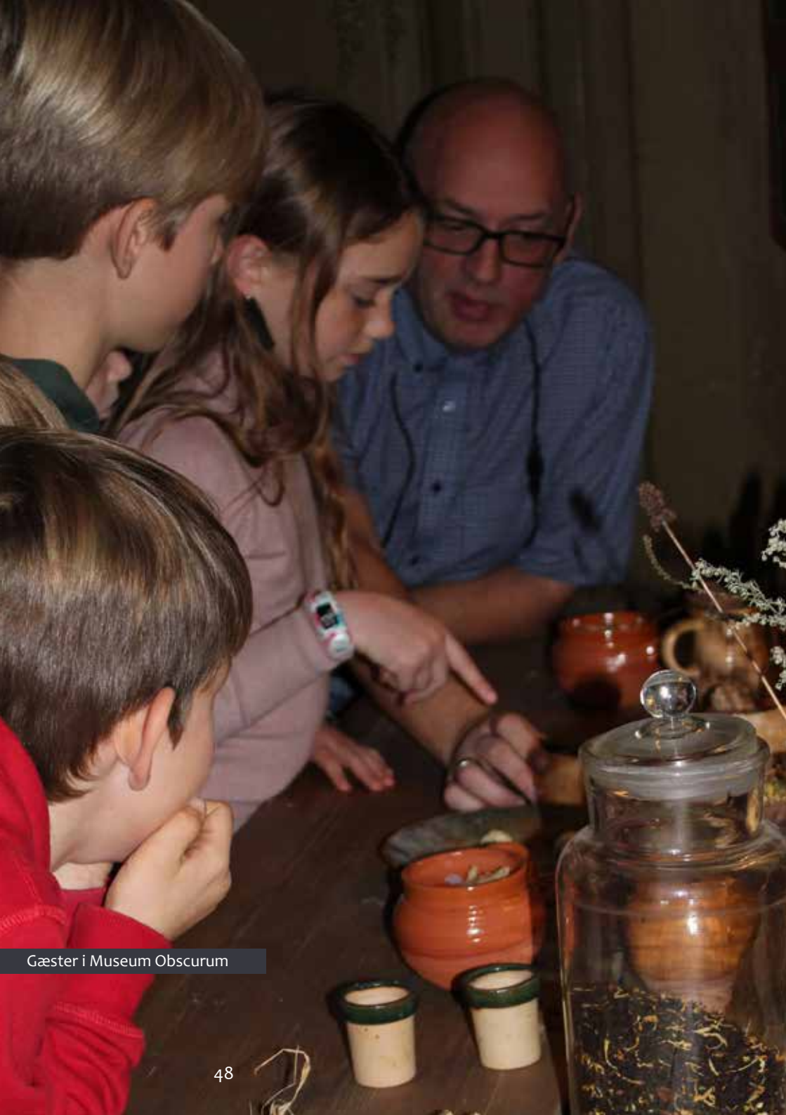
Gæster i Museum Obscurum

børn”. Disse to parametre er også nogle af dem, som gæsterne kommenterer på, når de kan komme med forslag til, hvordan museet kan forbedre oplevelsen. Her efterspørges muligheder for at deltage aktivt, interaktivitet og flere hands-on oplevelser, mens der også efterspørges mere børnevenlig formidling og aktiviteter for de helt små. Det kan være det, man kan arbejde videre med i udviklingen af museets tilbud. Udstillingen og atmosfæren er to parametre, museet scorer højest på. Det er helt i overensstemmelse med flere af kommentarerne i Den nationale brugerundersøgelse, hvor flere gæster skriver, at det var en rigtig god og spændende udstilling. Museet har altid haft en høj vurdering af medarbejdernes venlighed og imødekommenhed, og 2021 er ingen undtagelse. Her får museet en flot score på 9,7, hvor landsgennemsnittet ligger på 9,4.