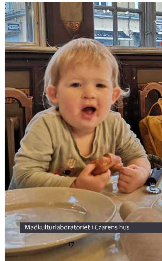
Madkulturlaboratoriet i Czarens hus

I EGN-projektet ser vi flere muligheder for fremtidigt samarbejde med CELF. Måske kan CELF-eleverne drive en køkkenhave ved De Gamle Huse, Maribos frilandsmuseum. CELF-elever kan involveres i 'Til middag hos-koncepterne' i fremtiden, eller CELF-elever kan involveres i vores Madkulturlaboratorium i Czarens Hus?