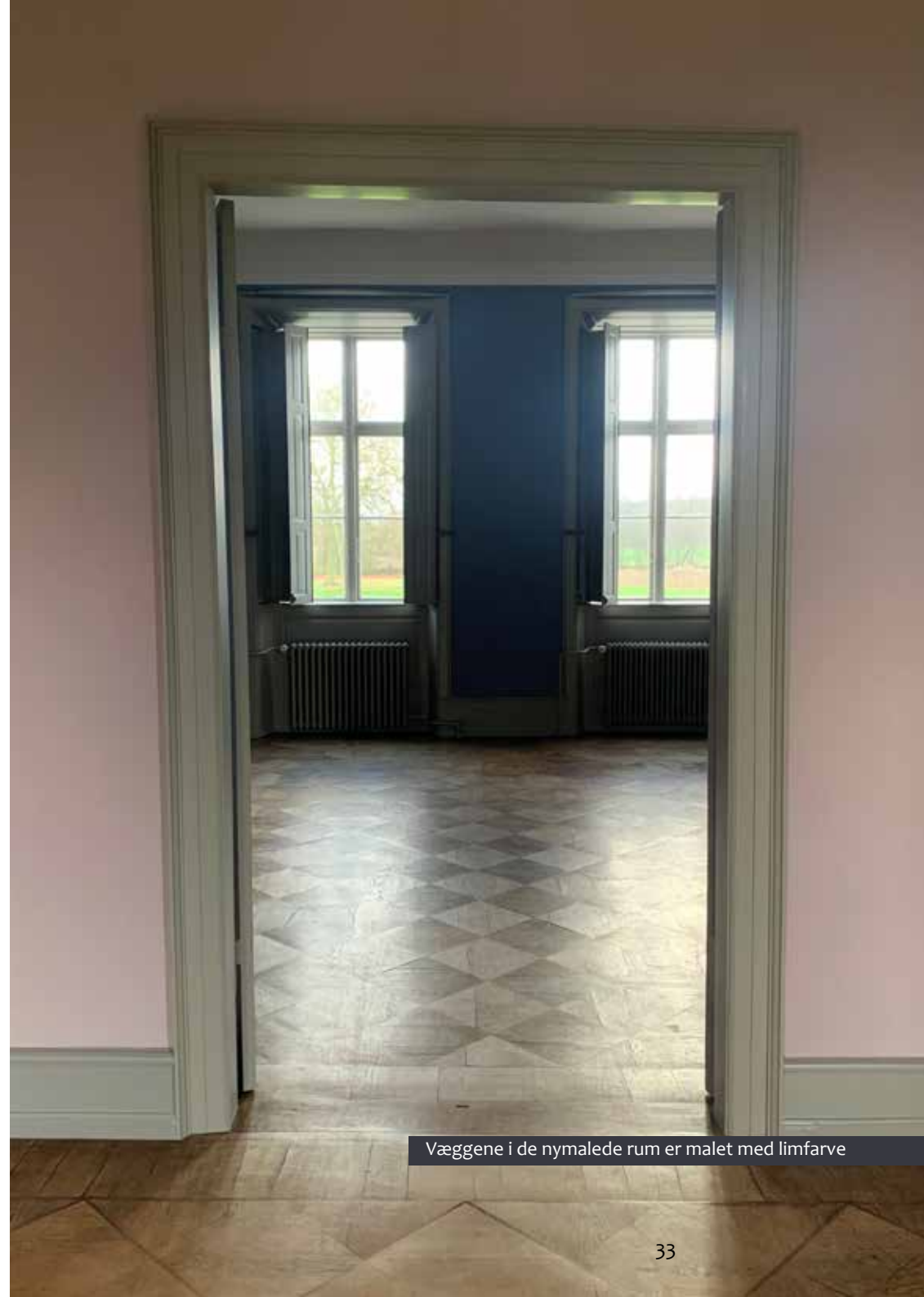
Væggene i de nymalede rum er malet med limfarve