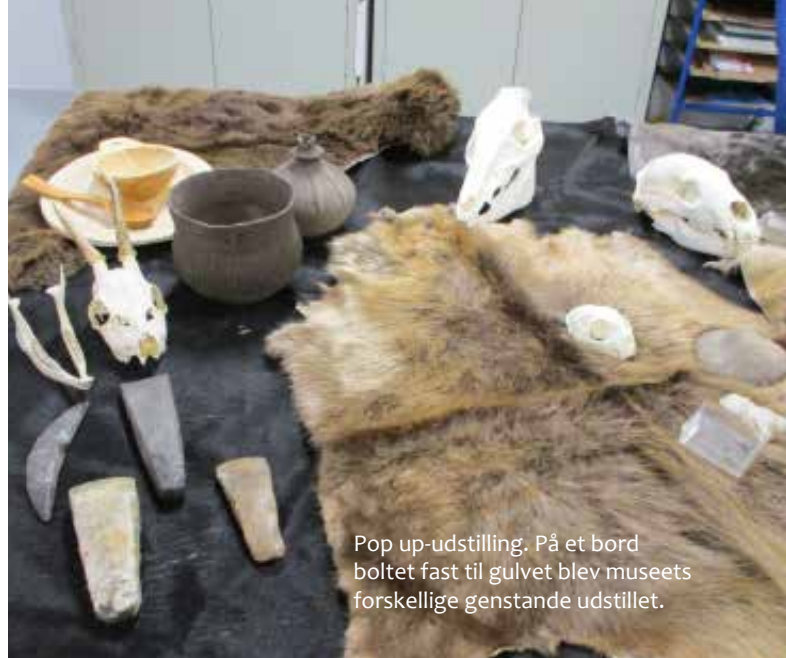
Pop up-udstilling. På et bord boltet fast til gulvet blev museets forskellige genstande udstillet.

De indsatte, der deltager i museets formidling, er indsatte, der er tilmeldt et udslusningsforløb, hvor de indgår i forskellige uddannelses- og/eller praktikforløb med henblik på ansættelse i virksomheder eller studiestart efter udstået fængselsstraf. Det er indsatte, som på den ene eller anden