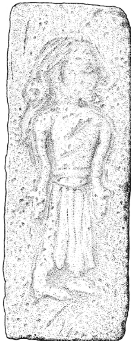
Guldgubbepatricen fra Midtfalster bearbejdet grafisk af Jeppe Boel Jepsen.

Fundet kan kaste nyt lys over magtforholdene på Falster mellem år 500 og 700 e.Kr. Guldgubber og dermed patricer hører til i den datidige samfundselite og dens centralpladser.