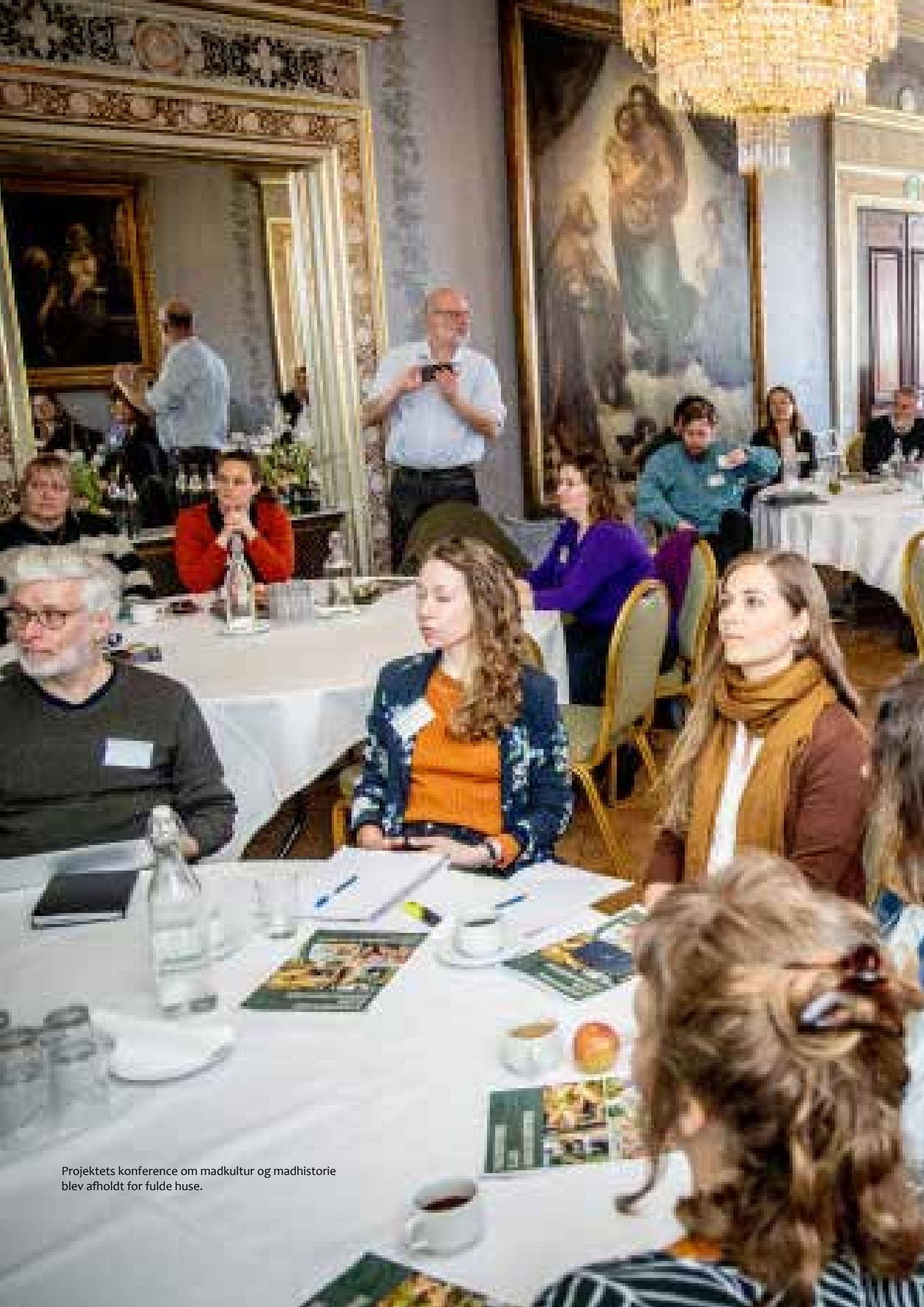
Projektets konference om madkultur og madhistorie blev afholdt for fulde huse.